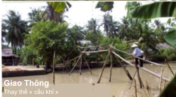
Giao Thông Thay thế « cầu khỉ »

Hội phi lợi nhuận được thành lập theo luật 1901, hoạt động nhờ sự đóng góp thiện nguyện ở Pháp và Việt Nam vào những dự án chính tại vùng Cần Thơ, Cà Mau, Đạ Tẻh, Hà Nội, Phú Thọ, Sơn Tây, Sơn La, Sapa.