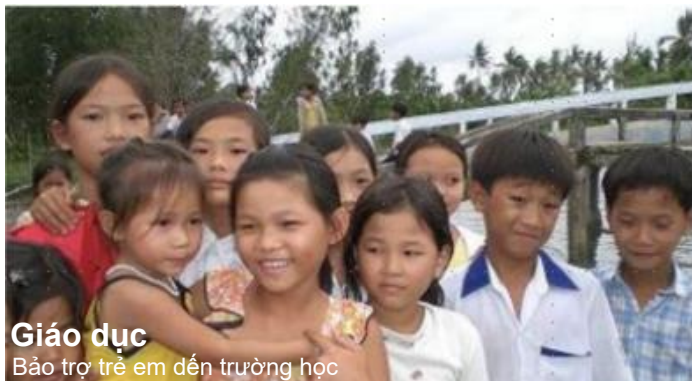
Giáo dục Bảo trợ trẻ em đến trường học