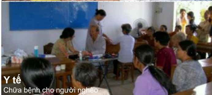
Y tế Chữa bệnh cho người nghèo