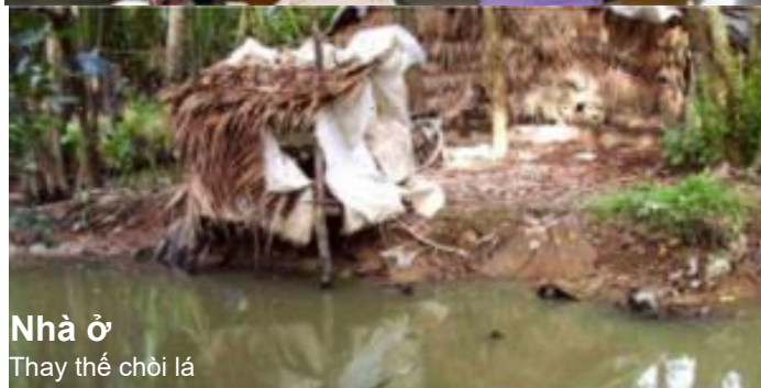
Nhà ở Thay thế chòi lá