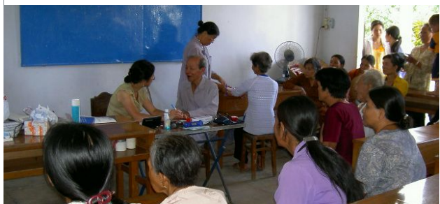
Santé Soigner les plus démunis