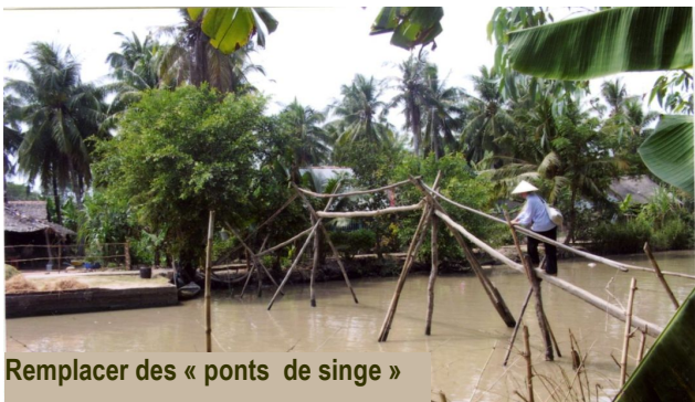
Remplacer des « ponts de singe »