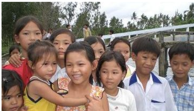
Parrainage Favoriser la scolarisation des enfants