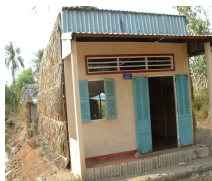
Coût moyen d'une maison 1 400€

Pour remplacer les abris précaires en bâches plastiques et cartons, aider les plus défavorisés à traverser la saison des pluies dévastatrices, 200 maisons ont été construites depuis 2003 grâce aux dons de particuliers, d'associations et d'entreprises françaises du bâtiment.