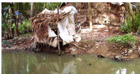
Habitat Remplacer des paillotes précaires